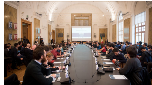
L'evento del 20 ottobre 2017 "Le Infrastrutture per lo sport. Luoghi Scenari Prospettive" al Politecnico di Milano